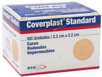
CURITA REDONDO COVERPLAST 100 PZAS $ 65