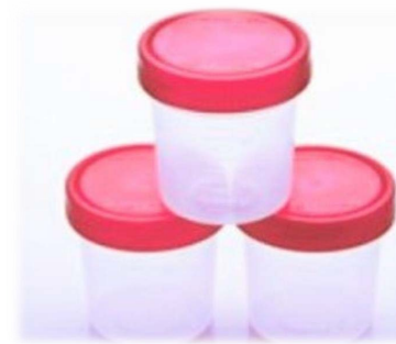
VASO ESTERIL P. MUESTRA 1 PZA $ 3.50