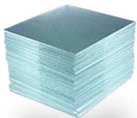
CUBREOBJETOS VELAB 22x22 100pzas