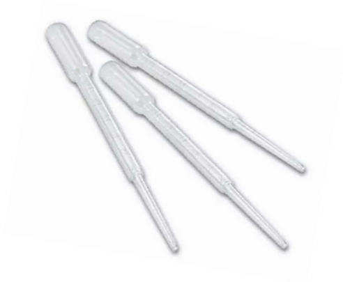
PIPETA TRANSFERENCIA DESHECHABLE 5 ML 250 PZAS $ 280