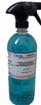
DESINFECTANTE DE SUPERFICIES $ 75