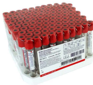
TUBO VACUTAINER ROJO.