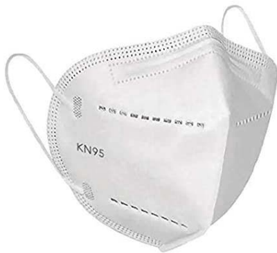
CUBREBOCA KN95 IMPORTADO CAJA C/10 PZA $ 180