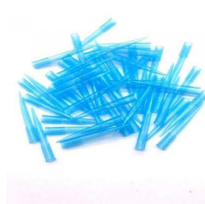
PUNTAS MICROPIPETAS AZULES