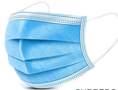
CUBREBOCA TRICAPA TERMOSELLADO PLISADO 50 PZAS $ 320