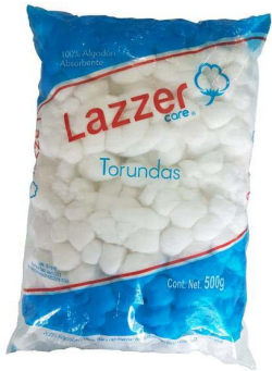
TORUNDA LAZZER 500 G $ 95