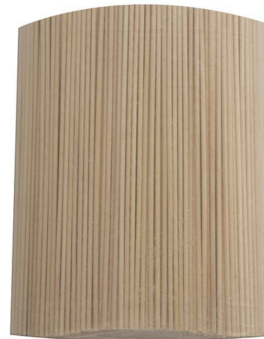
APLICADOR DE MADERA SIN ALGODÓN PINGUINO 750 PZAS $ 130