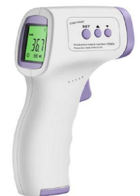
TERMÓMETRO INFRARROJO 1 PZA (FDA) $ 1,750