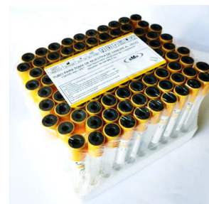
TUBO BMH ORO.