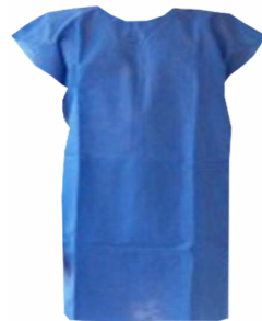
BATA PARA PACIENTE DESHECHABLE 10 PZAS $ 250