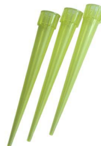
PUNTAS MICROPIPETAS AMARILLAS