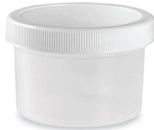
RECOLECTOR DE MUESTRA COPRO. POMADERA 1 PZA $ 3.00