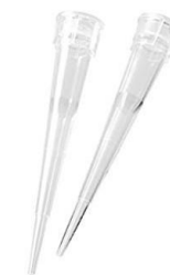
PUNTAS MICROPIPETAS NATURALES