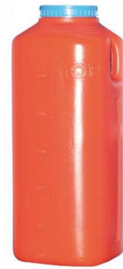
RECOLECTOR P ORINA 24 HRS $ 60