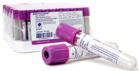
TUBO VACUTAINER LILA.