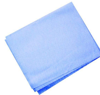
SABANA PARA PACIENTE DESHECHABLE 10 PZAS $ 250